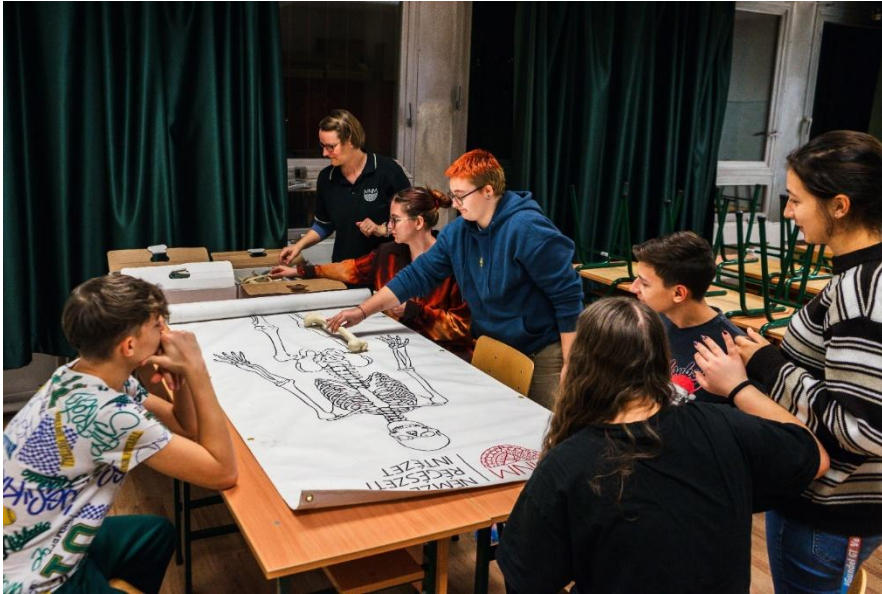
Interaktív régészeti foglalkozás