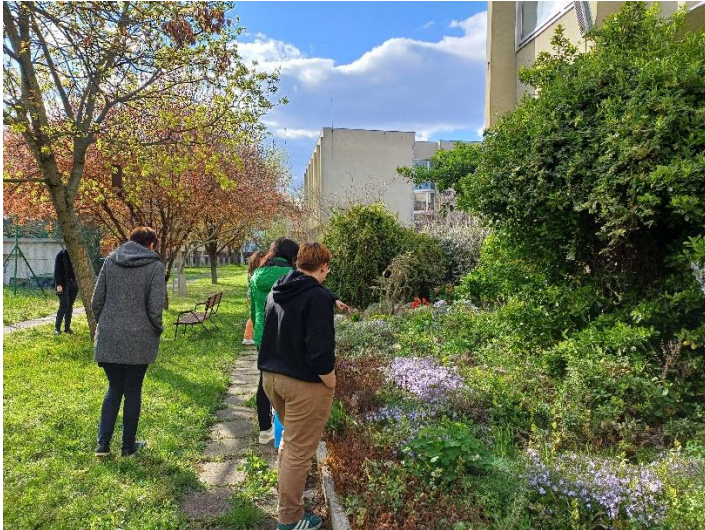
Séta a kertben, szemétszedés, madárodúk megtekintése, fűszerkert bejárása