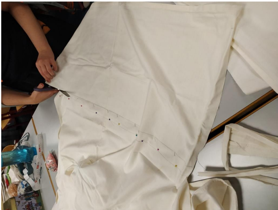
Régi lepedőkből vászontáskák készülnek